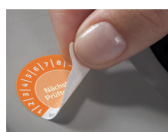
Usuwalna folia: nie zostawia śladów kleju przy usunięciu