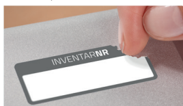
Tabliczki zabezpieczające NoPeel