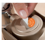
Plomba: przy próbie usunięcia pozostaje widoczny ślad