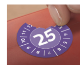
Folia NoPeel: przy próbie usunięcia rozpada się na drobne kawałki