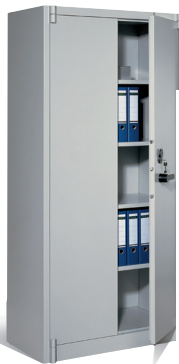
Szafa o podwyższonej odporności ogniowej Certos 195 x 93 x 50 cm masa ok. 120 kg 828462