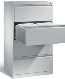
Metalowa szafa kartotekowa szeroka 135,7 x 78,7 x 59 cm 825664