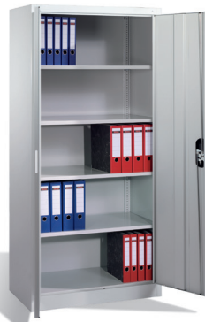
Metalowa szafa aktowa 198 x 100 x 42 cm 10203