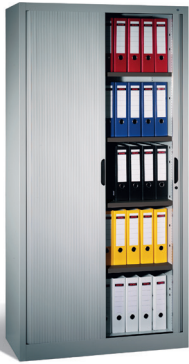
Szafa żaluzjowa z półkami 198 x 100 x 42 cm 828463

Dotyczy zamówień produktów w kolorze jasnoszarym RAL 7035