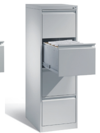
Szafa aktowa 135,7 x 43,3 x 59 cm 782074