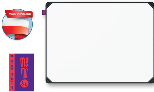
TABLICA SUCHOŚCIERALNA MAGNETYCZNA MEMOBE IDEA EDGE ALL BLACK

Minimalistyczne, aluminiowe profile, lekkość i maksymalny obszar roboczy to cechy charakterystyczne kolekcji EDGE ALL BLACK. Tablice można dostosować do indywidualnych preferencji i potrzeb użytkowych dzięki czterem powierzchniom do wyboru oraz trzem różnym rozmiarom dobranym tak, aby łączenie ich w zestawy było wygodne. Powierzchnia z wysokiej jakości stali lakierowanej na białą, o właściwościach magnetycznych. Przeznaczona do pisania dedykowanymi markerami do tablic suchościeralnych. Cienka rama wykonana z anodowanego aluminium w kolorze czarnym. Dwa kolory zaślepek do narożników: czerwone i szare. W każdym opakowaniu 6 magnesów z drewna bukowego w kolorze czerwonym. Łatwy montaż - śruby i kolki rozporowe w zestawie. Montaż w pionie lub poziomie w 4 rogach. Jednostka sprzedaży: 1 szt. 842657 – 600 x 450 mm 842658 – 900 x 600 mm 842659 – 1200 x 900 mm