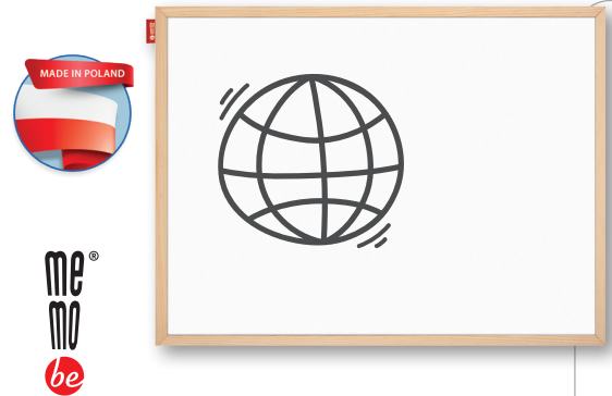
TABLICA SUCHOŚCIERALNA MAGNETYCZNA W RAMIE DREWNIANEJ MEMOBE

Powierzchnia z wysokiej jakości stali pokrytej starannie lakierem w kolorze białym. Tablica suchościeralna – można pisać po jej powierzchni dedykowanymi markerami. Właściwości magnetyczne pozwalają na zawieszanie grafik i kartek za pomocą magnesów. Rama wykonana z anodowanego aluminium. Łatwy montaż, śruby i kolki rozporowe w zestawie. Jednostka sprzedaży: 1 szt. 834655 – 60 x 40 cm 834660 – 180 x 120 cm 834657 – 90 x 60 cm 834661 – 200 x 100 cm 834658 – 120 x 90 cm 835835 – 200 x 120 cm 834659 – 150 x 100 cm 835836 – 240 x 120 cm 835834 – 180 x 90 cm 834663 – 300 x 120 cm