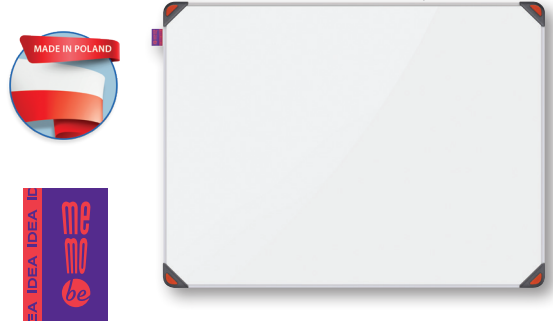
TABLICA SUCHOŚCIERALNA MAGNETYCZNA MEMOBE IDEA

Minimalistyczne, aluminiowe profile, lekkość i maksymalny obszar roboczy to cechy charakterystyczne kolekcji EDGE ALL BLACK. Tablice można dostosować do indywidualnych preferencji i potrzeb użytkowych dzięki czterem powierzchniom do wyboru oraz trzem różnym rozmiarom dobranym tak, aby łączenie ich w zestawy było wygodne. Powierzchnia z wysokiej jakości stali lakierowanej na białą, o właściwościach magnetycznych. Przeznaczona do pisania dedykowanymi markerami do tablic suchościeralnych. Cienka rama wykonana z anodowanego aluminium w kolorze czarnym. Dwa kolory zaślepek do narożników: czerwone i szare. W każdym opakowaniu 6 magnesów z drewna bukowego w kolorze czerwonym. Łatwy montaż - śruby i kolki rozporowe w zestawie. Montaż w pionie lub poziomie w 4 rogach. Jednostka sprzedaży: 1 szt. 842657 – 600 x 450 mm 842658 – 900 x 600 mm 842659 – 1200 x 900 mm